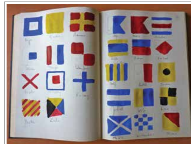
Alphabet de drapeaux de signalisation - double page dans livre d'esquisse - 40 x 30 cm